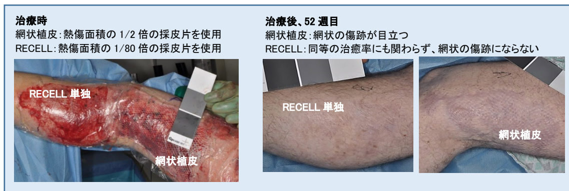
図2: 米国の臨床試験より:同一患者にて、RECELL 単独治療と2倍網状植皮の治療